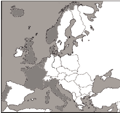
Mapa A .....

Mapy przedstawiają proces rozwoju terytorialnego NATO w Europie. Do zamieszczonych map dobierz odpowiadające im tytuły. W wyznaczone miejsca wpisz właściwe numery.