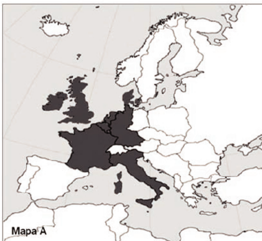
Mapa A. ....

Mapy przedstawiają proces rozwoju terytorialnego Unii (Wspólnot) Europejskiej. Do zamieszczonych map dobierz odpowiadające im tytuły. W wyznaczone miejsca wpisz właściwe numery.