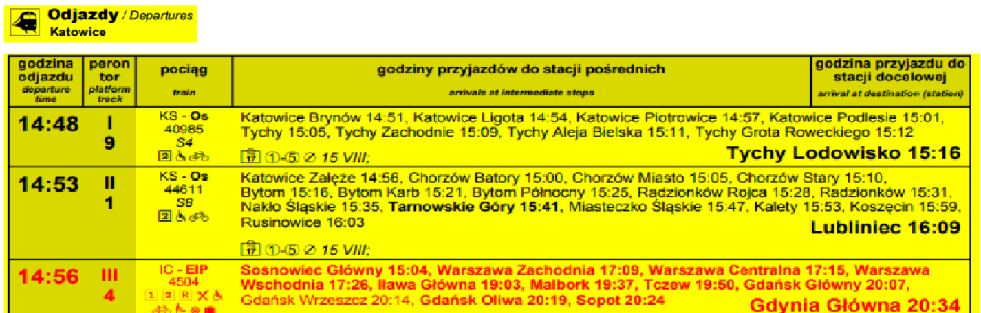
Rozkład jazdy PKP ( fragment )

Korzystając z zamieszczonego fragmentu rozkładu jazdy PKP określ, których informacji należy udzielić turystyce planującemu podróż bezpośrednim pociągiem z Katowic do Malborka.