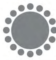
C. Okrągły stół.