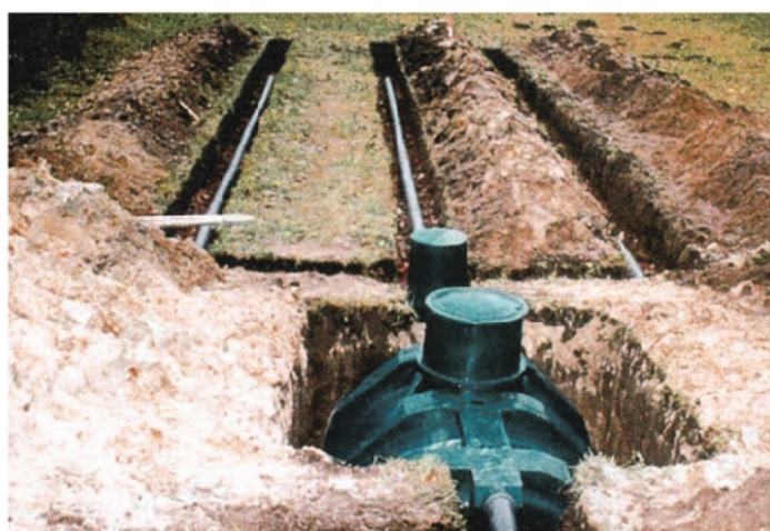
Rys. 3. Oczyszczalnia ścieków w trakcie wykonywania robót budowlanych

Uwaga! W Tabeli 2 zsumowane wyniki w wierszu „Razem” zaokrąglaj do pełnych metrów.