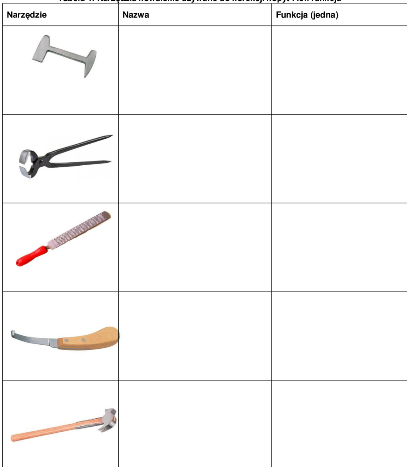
Tabela 1. Narzędzia kowalskie używane do korekcji kopyt i ich funkcja