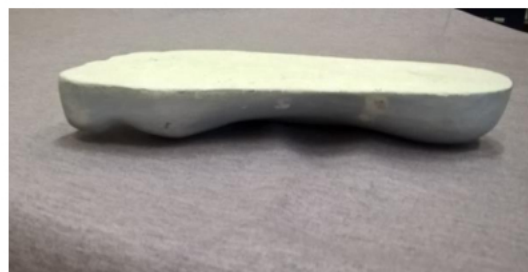
Zdjęcie 4. Widok pozytywu stopy od przyśrodkowej strony