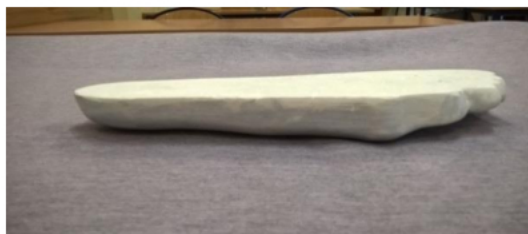
Zdjęcie 3. Widok pozytywu stopy od zewnętrznej strony