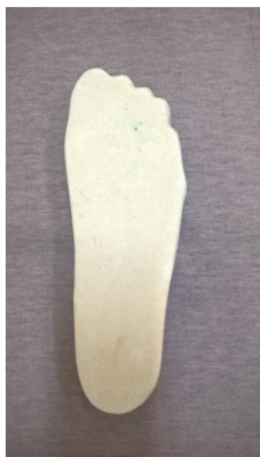
Zdjęcie 1. Widok pozytywu stopy z góry