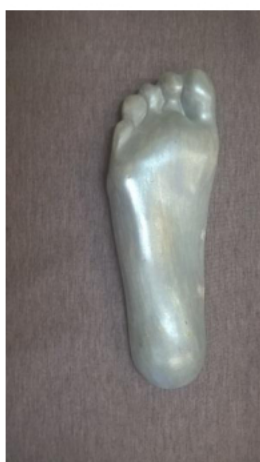
Zdjęcie 2. Widok pozytywu stopy od spodu