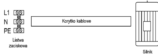
Rys 2. Rozmieszczenie elementów układu elektrycznego