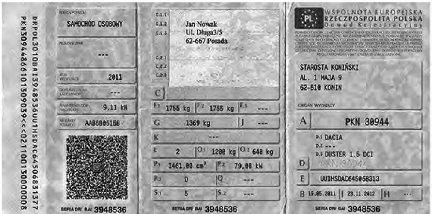
Rysunek 1. Dowód rejestracyjny pojazdu.