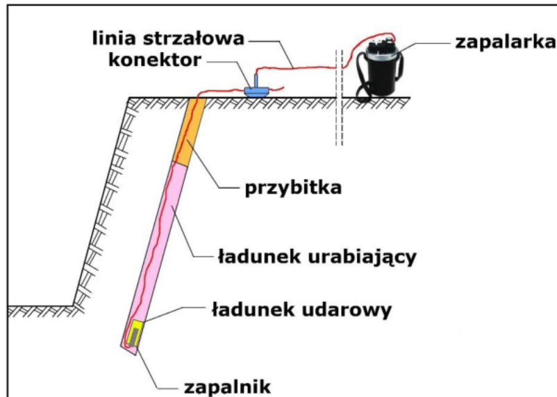
Rysunek 2. Schemat pojedynczego otworu strzałowego

Na podstawie danych zamieszczonych w arkuszu egzaminacyjnym: