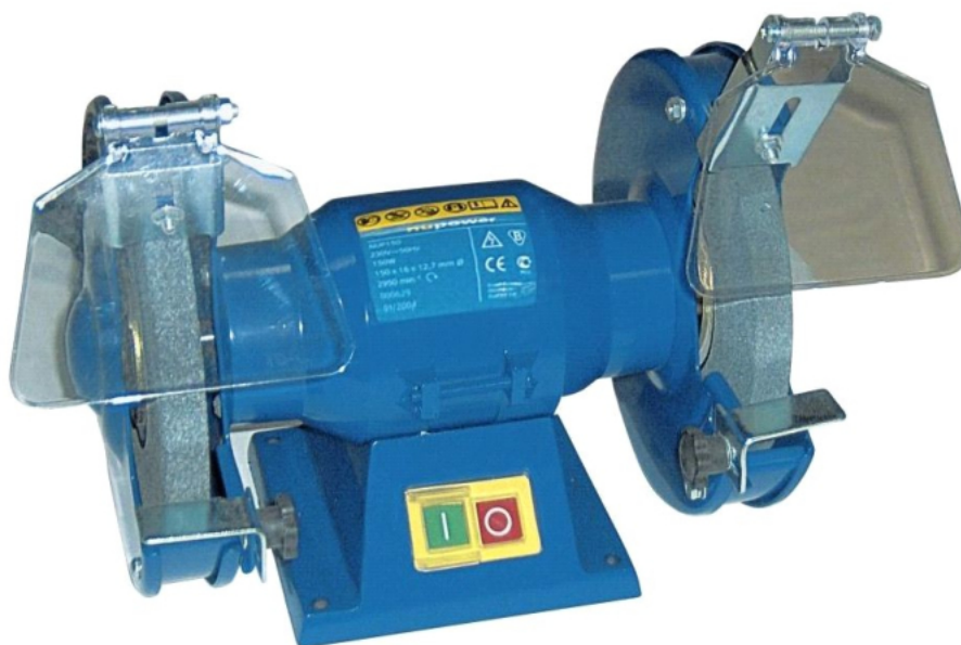
Rysunek 2. Stołowa szlifierka dwutarczowa

Czas przeznaczony na wykonanie zadania wynosi 120 minut.