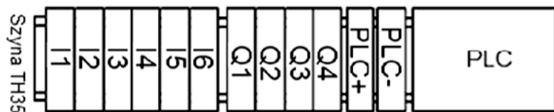
Rys. 1. Sterownik PLC z listwami I1-I2-I3-I4-I5-I6, Q1-Q2-Q3-Q4 oraz PLC+/PLC-