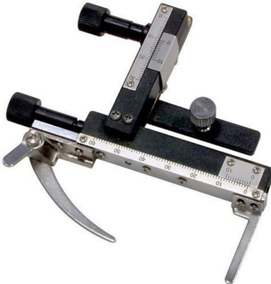
Rysunek 1. Nasadka krzyżowa do stolika mikroskopowego

Po wykonaniu zadania uporządkuj stanowisko pracy.