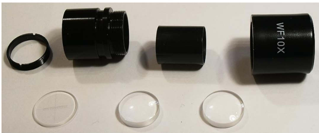
Rysunek 2. Zespół okularu mikroskopowego w rozbiórce na części.

Czas przeznaczony na wykonanie zadania wynosi 120 minut.