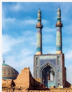
Meczet Jameh w Yazd – największy meczet w Iranie