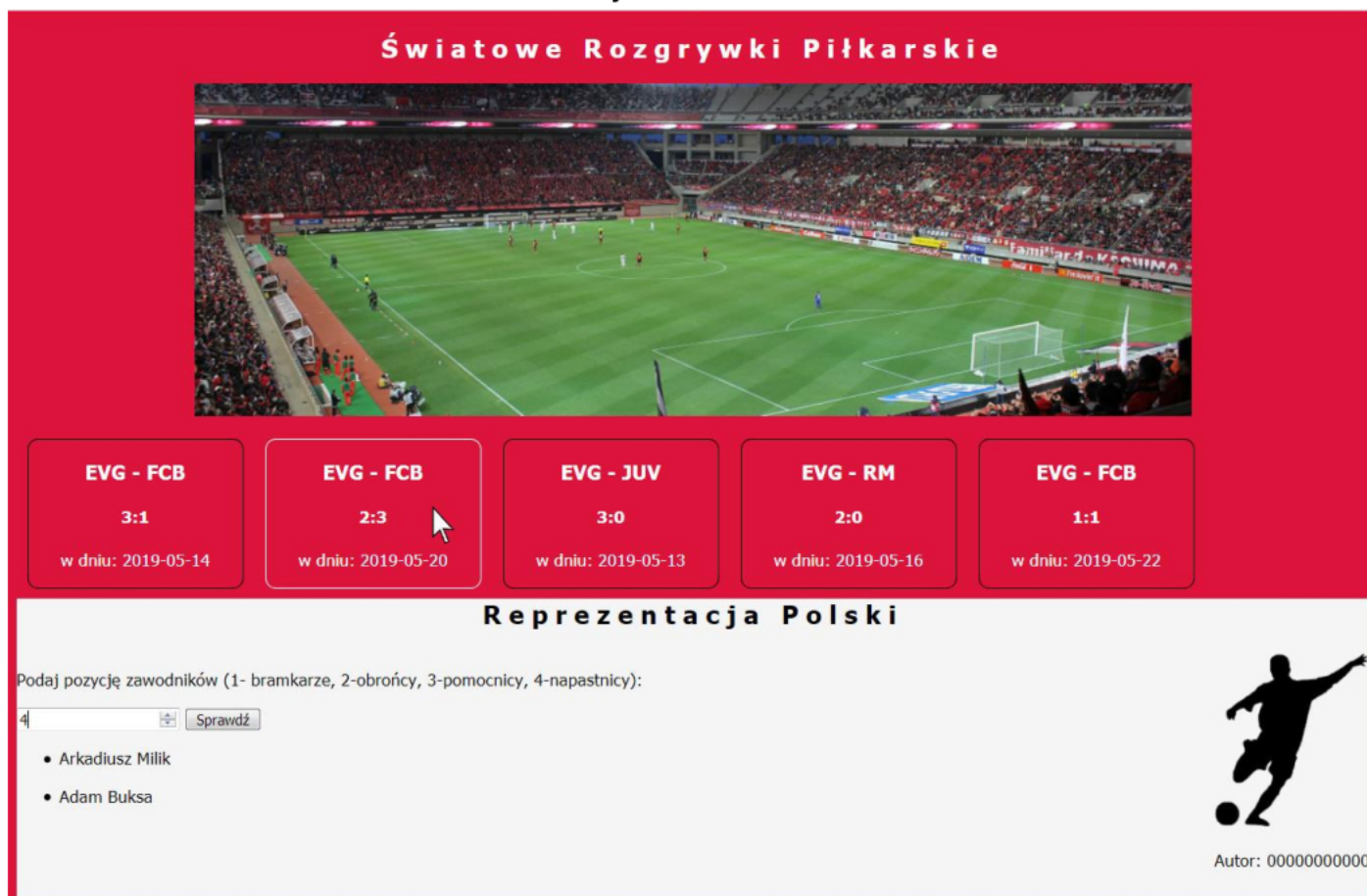
Obraz 2. Witryna internetowa, kursor na drugim bloku informacyjnym, zmienił się kolor obramowania