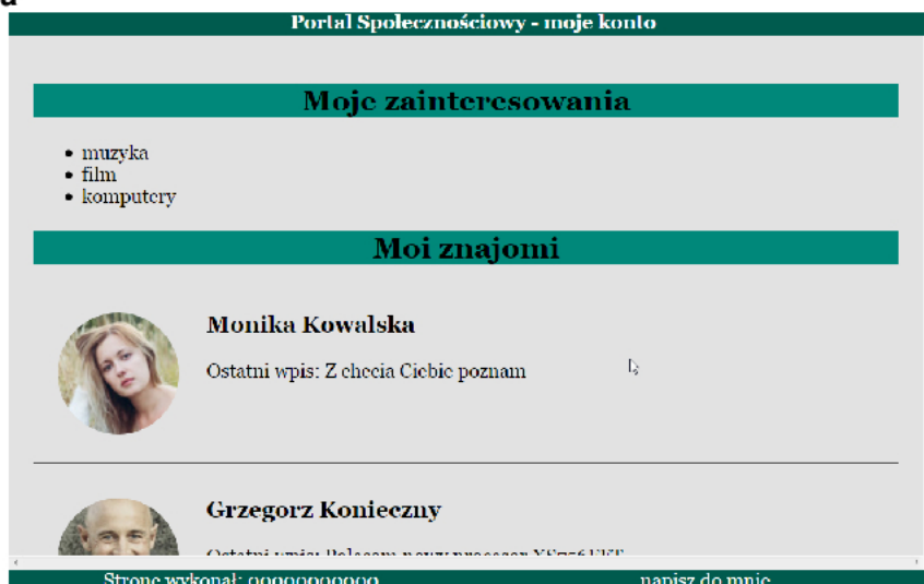
Obraz 2. Witryna internetowa, strona lista.php