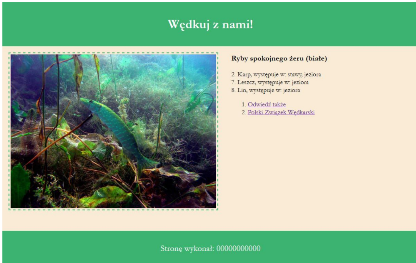
Obraz 2. Witryna internetowa