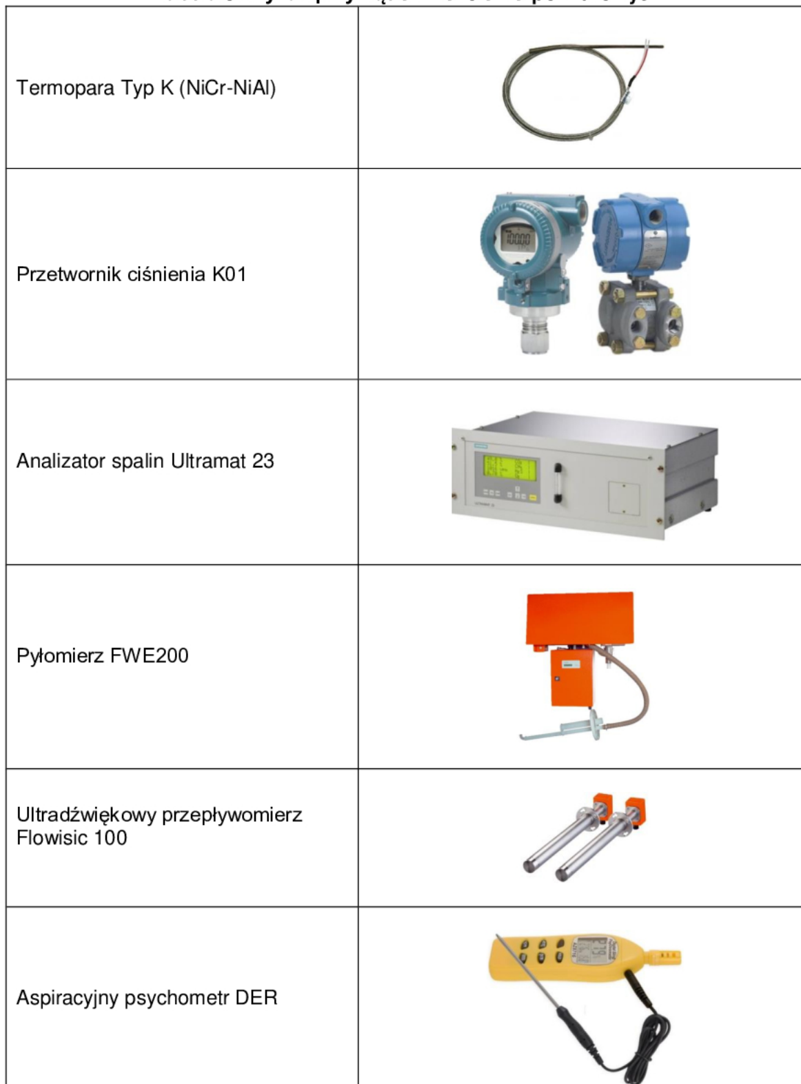
Tabela 3. Wykaz przyrządów kontrolno-pomiarowych