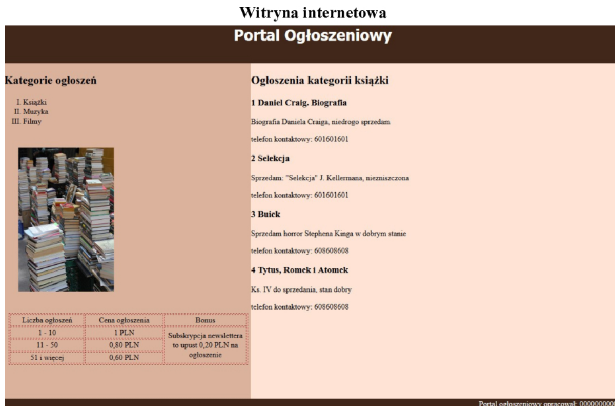
Obraz 2. Witryna internetowa