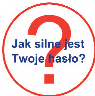
Rysunek 1. Grafika

Witryna internetowa wykorzystuje grafikę, którą należy przygotować i jest ona zgodna z rysunkiem 1.