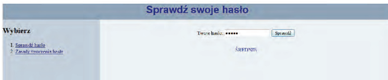
Rysunek 3. Fragment strony haslo.html z efektem działania skryptu

Rysunek 3 przedstawia efekt działania skryptu. Wpisano hasło „qwe12”, zgodnie z tabelą 1 jest ono średnie. Tekst ŚREDNIE w kolorze niebieskim został wyświetlony przez skrypt. Należy zauważyć, że rysunek 3 jest tylko fragmentem wyświetlanej strony.