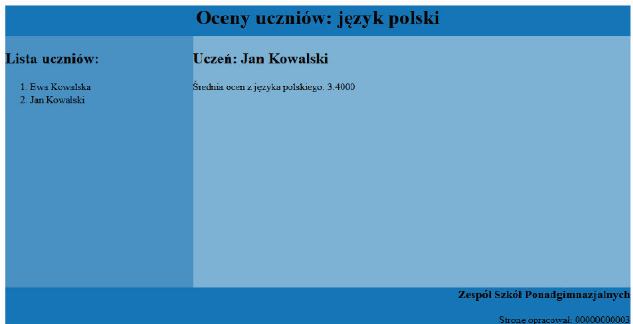
Rysunek 2. Witryna internetowa

Witryna internetowa przedstawiona jest na rysunku 2.