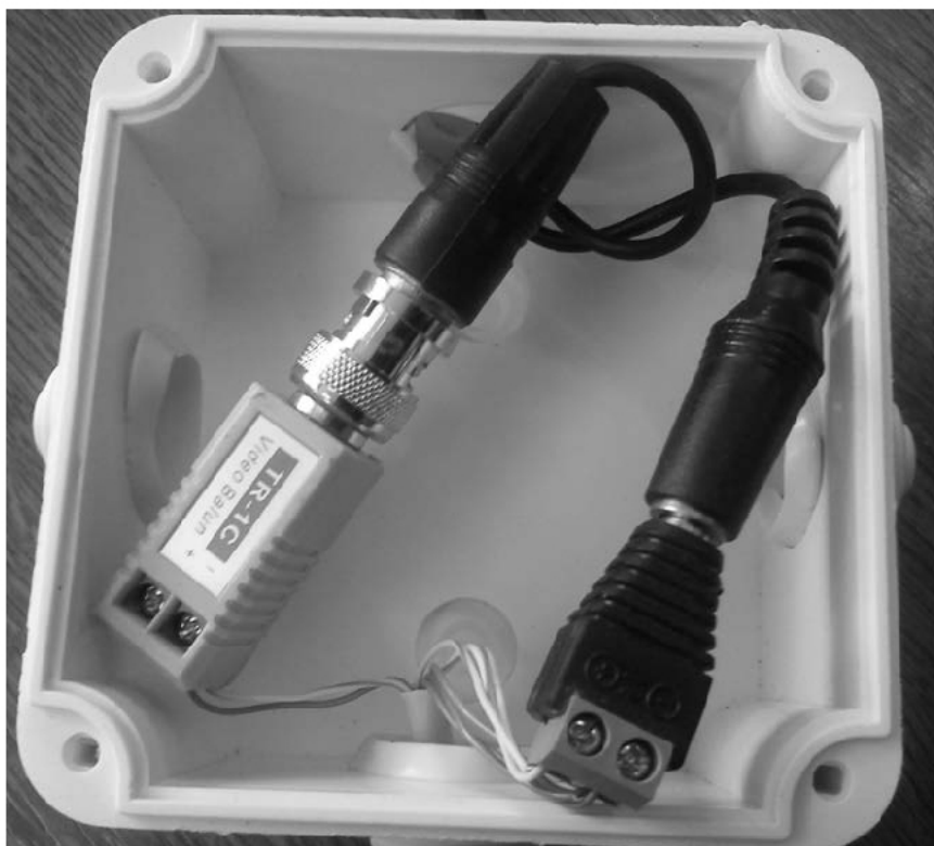
Rysunek 3. Połączenia w puszkach elektroinstalacyjnych