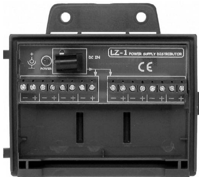
Rysunek 5. Widok wnętrza listwy zasilającej

Czas przeznaczony na wykonanie zadania wynosi 180 minut.