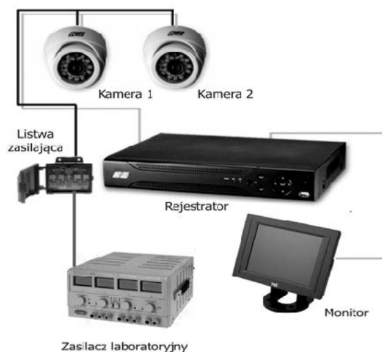
Rysunek 1. Schemat poglądowy instalacji monitoringu

Po wykonaniu instalacji uporządkuj stanowisko pracy. Rezultaty wykonania zadania pozostaw na stanowisku egzaminacyjnym.