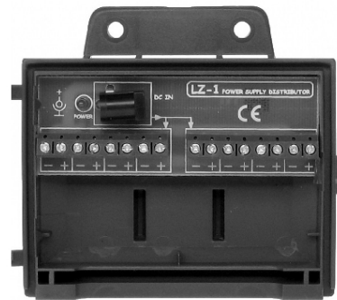
Rysunek 5. Widok wnętrza listwy zasilającej