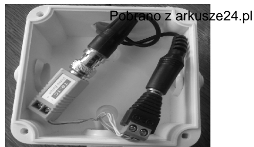
Rysunek 3. Połączenia w puszkach elektroinstalacyjnych