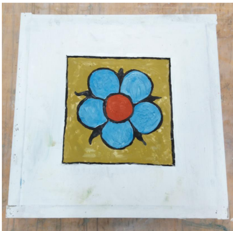
Rysunek 1. Widok gotowego fresku

Wykonany fresk pozostaw na stanowisku egzaminacyjnym.