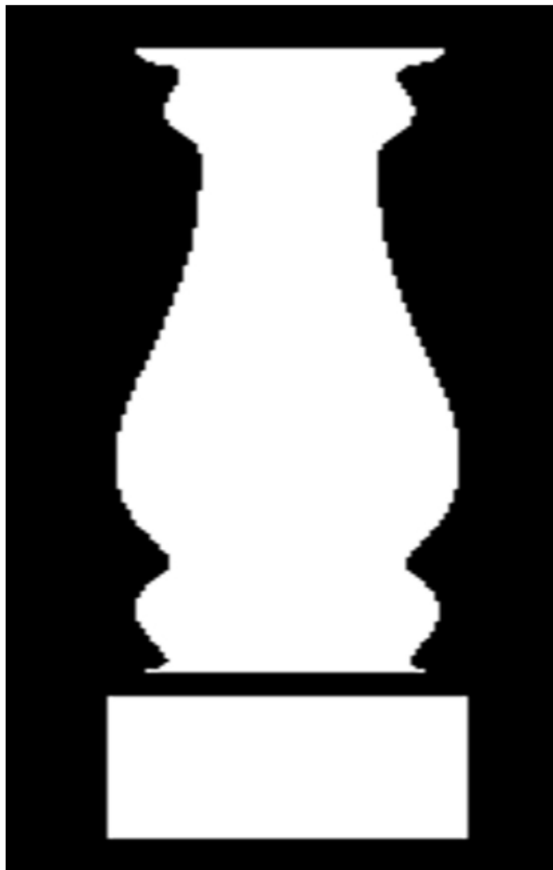
Rysunek 1. Ortogonalny widok sgraffita

Czas przeznaczony na wykonanie zadania wynosi 180 minut.