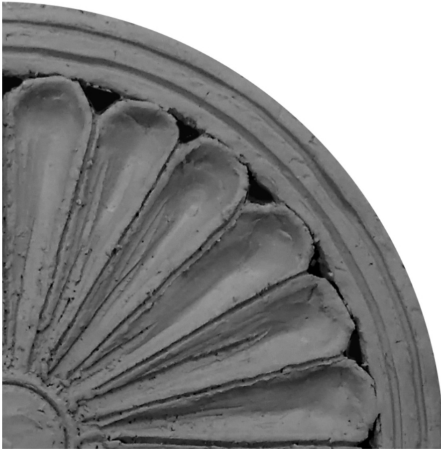
Rysunek 1. Ortogonalny widok fragmentu rozety do wykonania