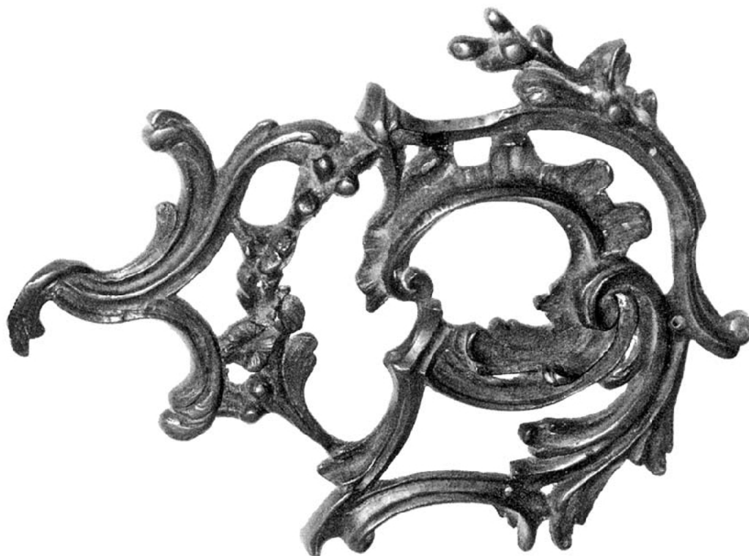
Rysunek 1. Ortogonalny widok sztukaterii.

Po ukończeniu czynności oczyść używane narzędzia i uporządkuj stanowisko pracy.