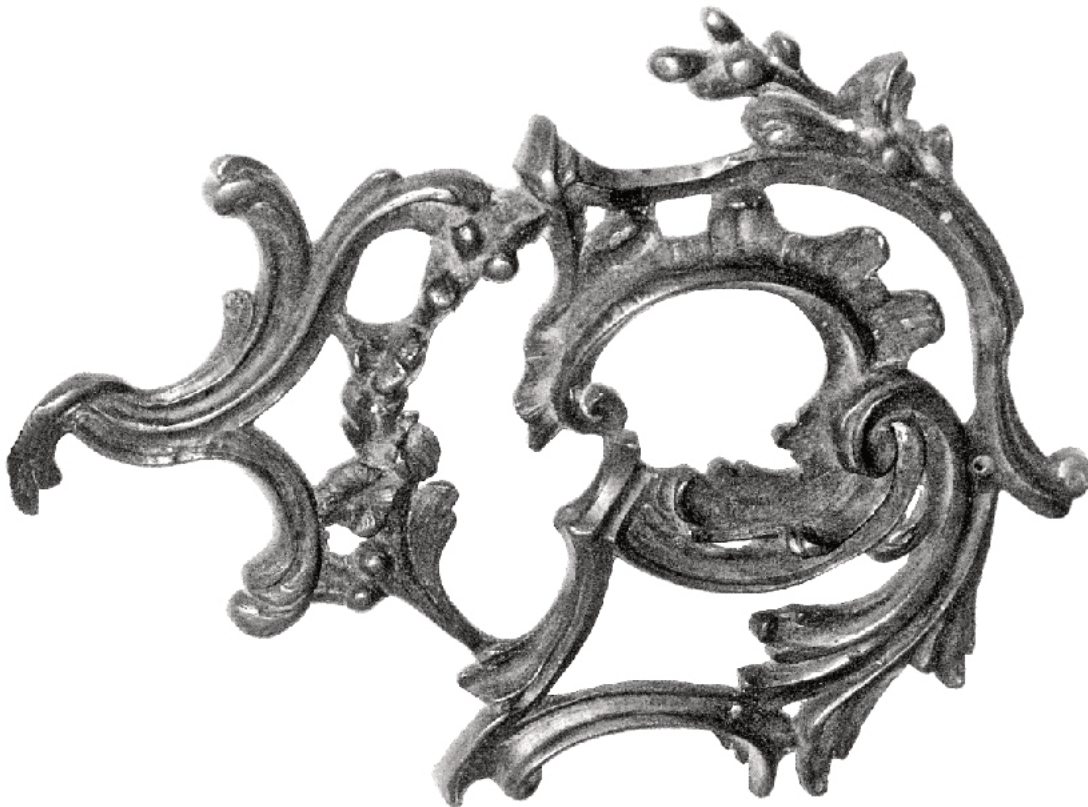
Rysunek nr 1. Ortogonalny widok sztukaterii.

Po ukończeniu czynności oczyść używane narzędzia i uporządkuj stanowisko pracy.