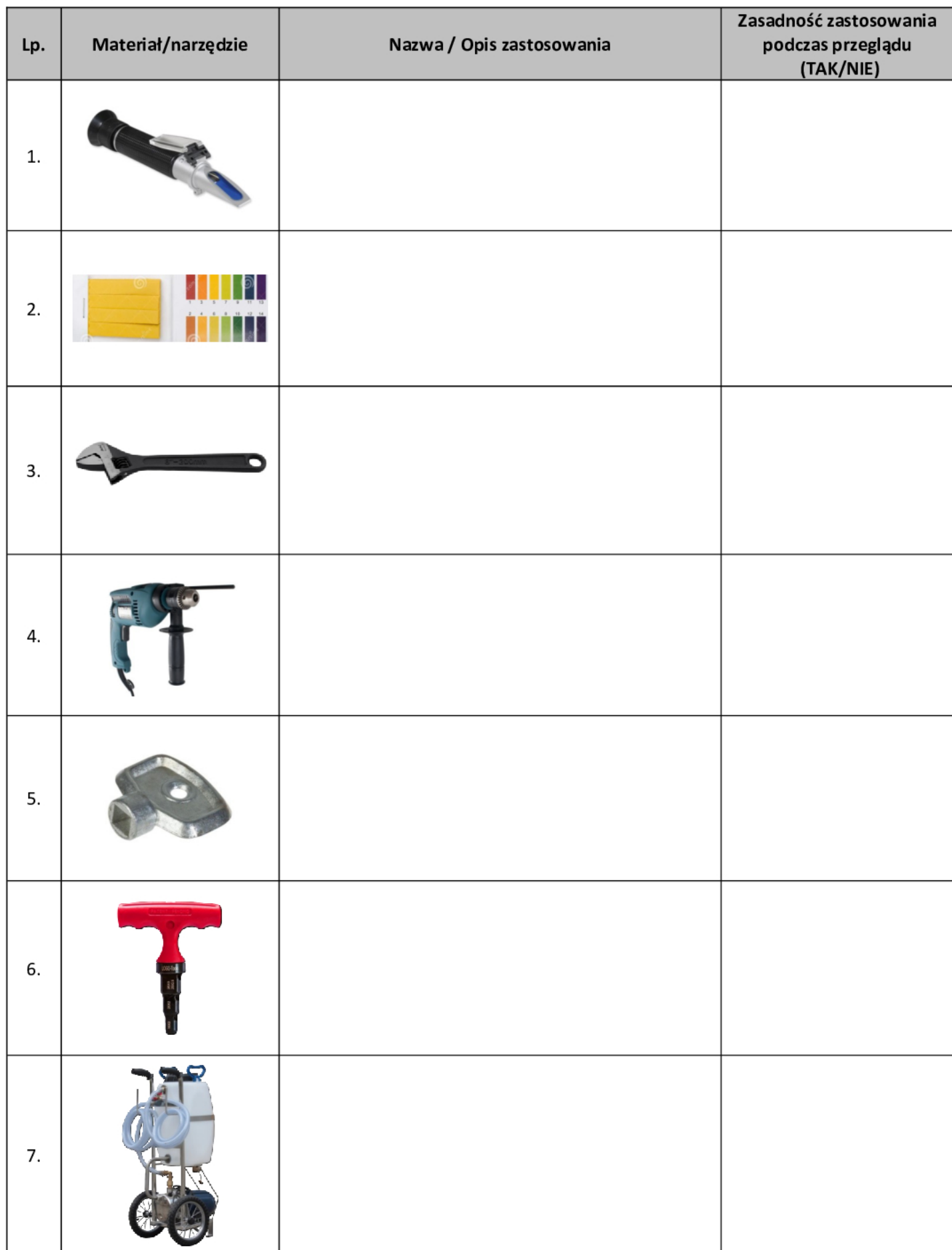
Tabela A. Materiały oraz narzędzia do przeprowadzenia przeglądu technicznego słonecznej instalacji grzewczej