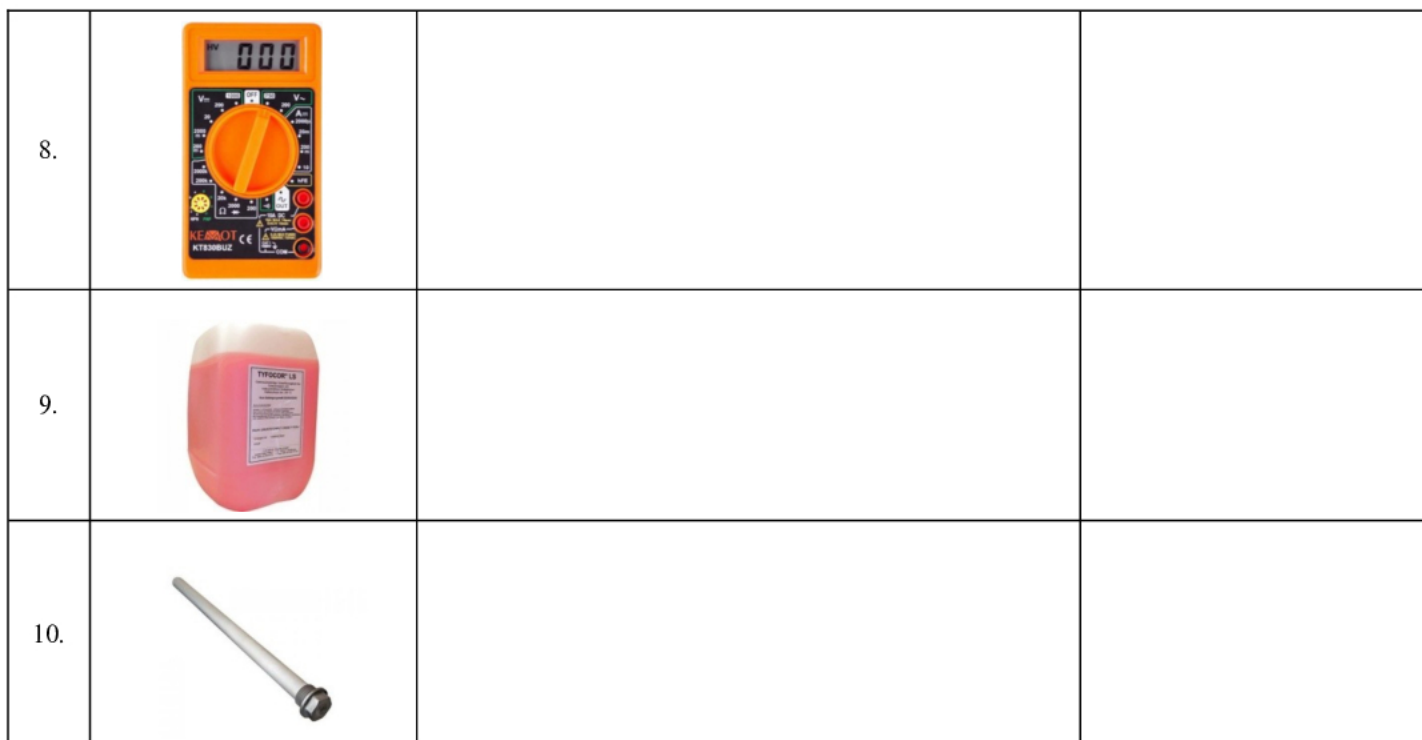
Tabela B. Obliczenia parametrów pracy słonecznej instalacji grzewczej