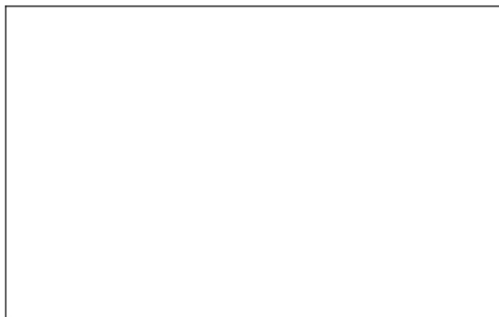
Tabela 2. Wykaz właściwości fizykochemicznych roztworu kwasu solnego o stężeniu 37%

(do oznaczenia butelki z przygotowanym roztworem kwasu solnego)