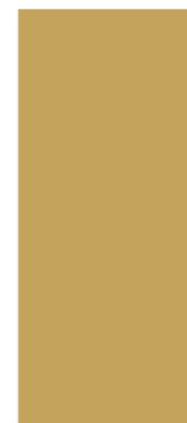
wzorec koloru złotego CMYK (0, 20, 60, 20)