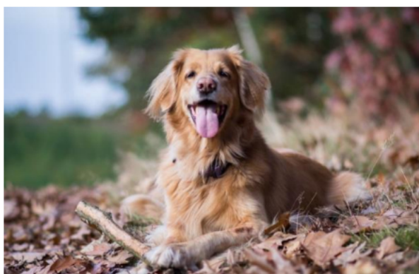
zdjęcie psa z pliku pies.jpg