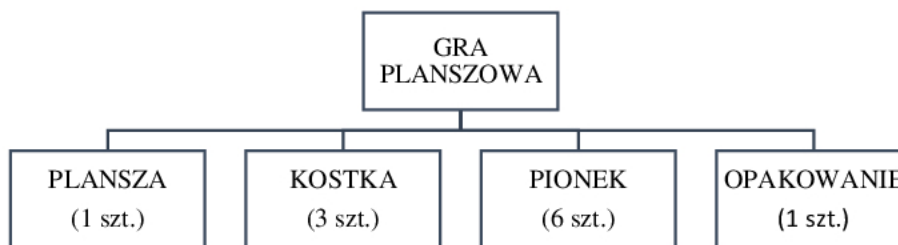
Struktura wyrobu gotowego

Przedsiębiorstwo otrzymało zamówienie na 1 500 gier planszowych. W magazynie wyrobów gotowych znajduje się 645 gier planszowych, a produkcja w toku wynosi 185 gier planszowych. Uwzględniając stan magazynowy, produkcję w toku oraz strukturę wyrobu gotowego oblicz, ile kostek brakujących do realizacji zamówienia gier planszowych, należy wydać z magazynu?