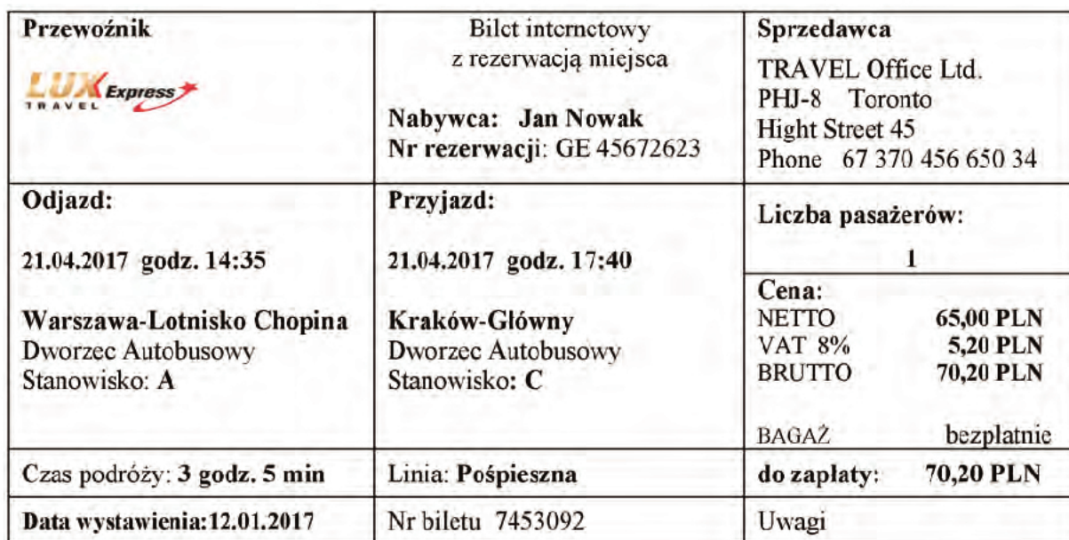
Tabela 3. Wydruk internetowej rezerwacji biletu autobusowego

Na trasie: Toronto-Warszawa różnica czasu 6 godzin