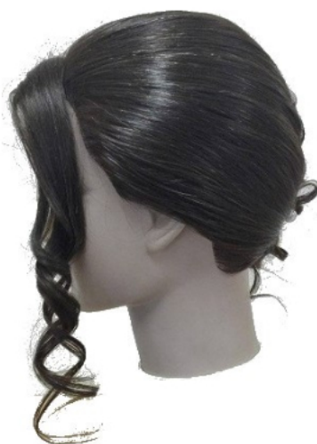
Widok – lewy bok