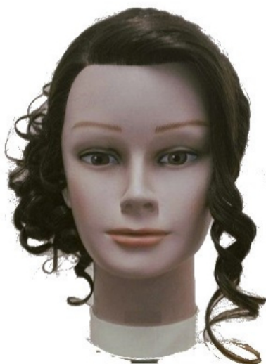
Widok – przód