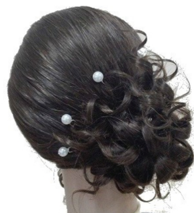
Widok – tył