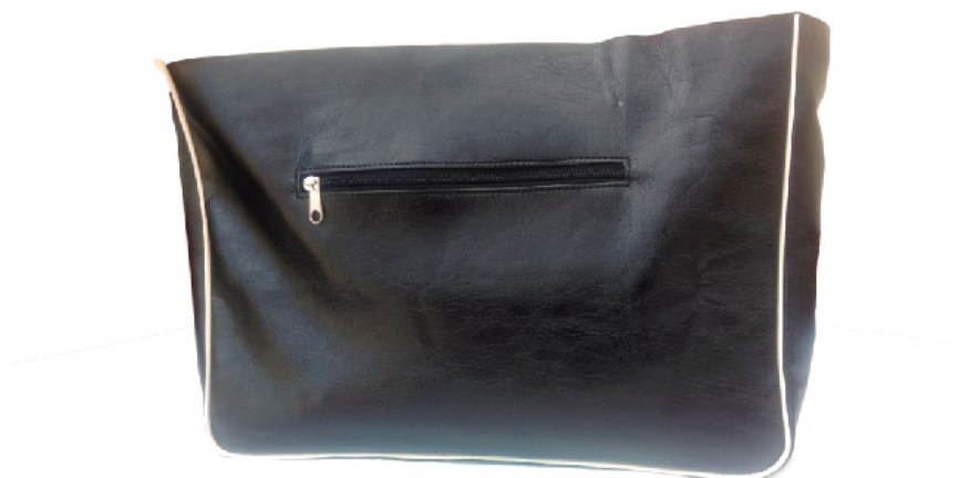
Zdjęcie 1. Fragment torebki damskiej z kieszenią.

przebieg wykonania fragmentu torebki damskiej z kieszenią.