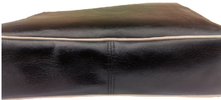
Zdjęcie 2. Przeszycie bodno torebki damskiej.